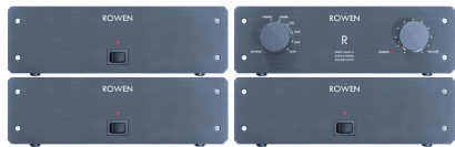
2 x Rowen PA1, Rowen PR2, Rowen PS2

Bi- oder Tri-Active Betrieb: mode bi- ou tri-active: